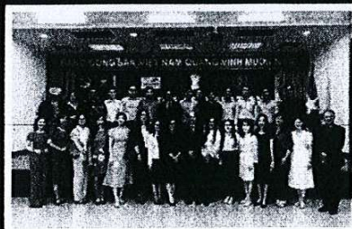
(Kỷ niệm gặp gỡ cựu học viên ITEC 2023)

Những khóa đào tạo ngắn hạn này dành cho cán bộ, nhân viên nhà nước và tư nhân, các trường đại học, các phòng thương mại và công nghiệp, v.v. trong độ tuổi từ 25-45, có kinh nghiệm làm việc phù hợp, có trình độ tiếng Anh và chưa từng theo học khóa đào tạo nào do Chính phủ Ấn Độ tài trợ. Học bổng gồm vé máy bay quốc tế khứ hồi, lệ phí visa, học phí, tài liệu học tập, chỗ ở, trợ cấp sinh hoạt phí hàng ngày và các chuyến tham quan thực tế trong thời gian khóa học.