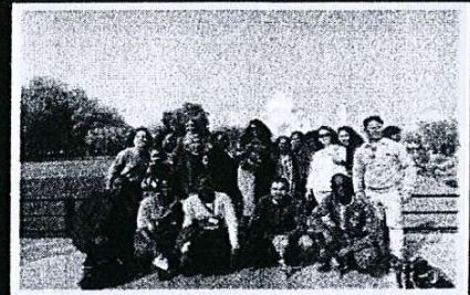
(Học viên ITEC Việt Nam chụp ảnh trước lăng mộ Taj Mahal nổi tiếng)

Scan QR code to access the Embassy's Facebook Quét mã QR để truy cập trang Facebook Đại sứ quán